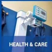
HEALTH &amp; CARE